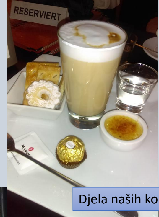
Djela naših konobara

"Great skills. He knows a lot and learns really fast."