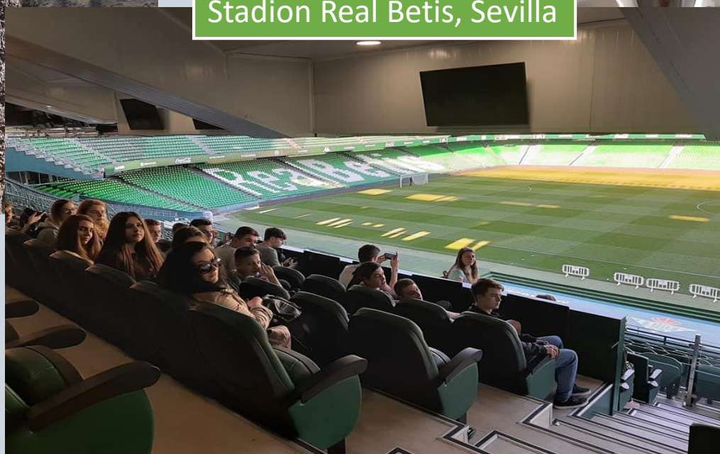
Stadion Real Betis, Sevilla