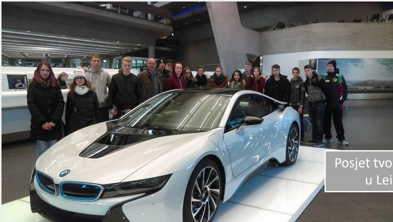
Posjet tvornici BMW u Leipzigu